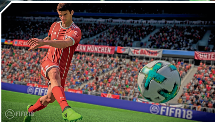
OBEN: Das Stadion Santiago Bernabéu in Spanien.