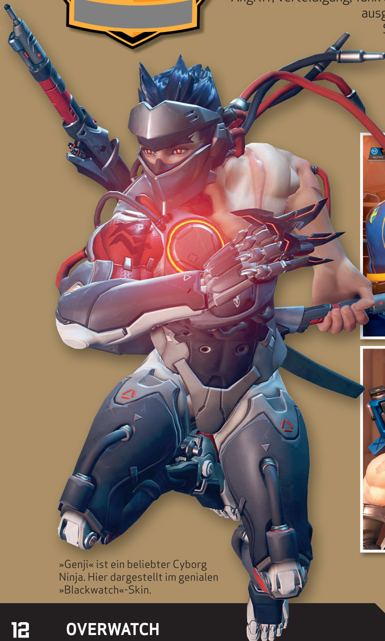
»Genji« ist ein beliebter Cyborg Ninja. Hier dargestellt im genialen »Blackwatch«-Skin.

Die ultimative Fähigkeit von Heldin »Ana« ist der »Nano Boost«. Damit verwandelt sie die anderen aus ihrem Team in Supersoldaten.