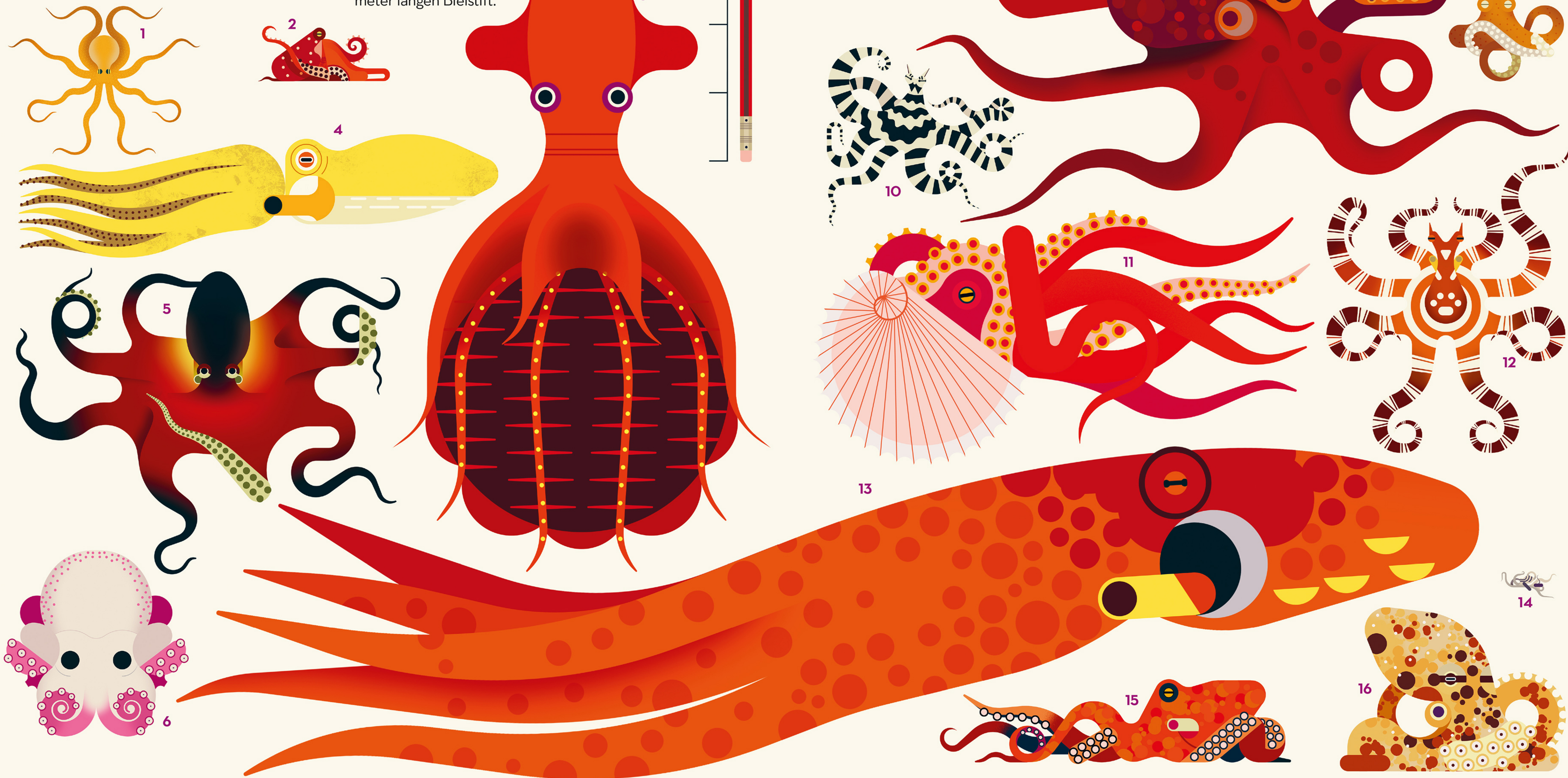
1 Goldfleckenkralke 2 Octopus mercatoris 3 Stauroteuthis syrtensis 4 Octopus berrima 5 Ader-Oktopus 6 Tiefsee-Oktopus 7 Kleiner Blaugeringelter Krake 8 Pazifischer Roter Krake

Die meisten Arten sind viel kleiner als der Pazifische Riesenkrake. Hier siehst du die Größe einiger anderer Krakenarten im Vergleich mit einem 20 Zentimeter langen Bleistift.