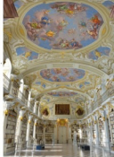
Im Stift Admont bekommen Besucher die größte Klosterbibliothek der Welt zu Gesicht.

Wenige Schritte vom Schloss entfernt, streckt sich die gute Stube Steys aus – der mittelalterliche Stadtplatz. Mitten-