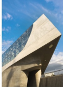
Futuristischer Baus: das phæno Science Center in Wolfsburg

www.braunschweiger-land.org www.zerbst.de www.geopark-harz.de