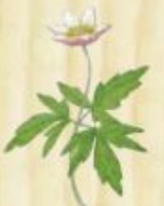
das Buschwind- röschen