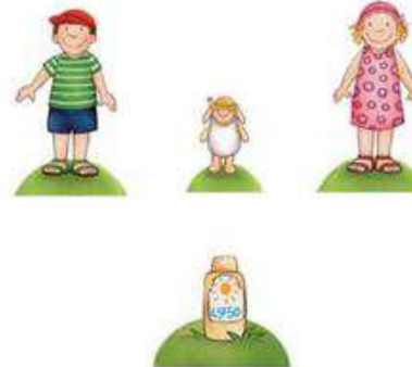
Emma, Paul und Schäfchen auf mittlere Schiene stecken; Sonnencreme links in hinterste Schiene stecken

Welche Figuren kommen zum Einsatz? Was wird erzählt und gespielt?