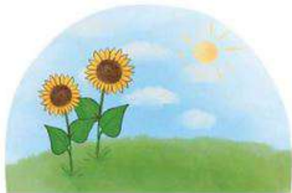
Hintergrund in hinterste Schiene stecken

Welche Figuren kommen zum Einsatz? Was wird erzählt und gespielt?