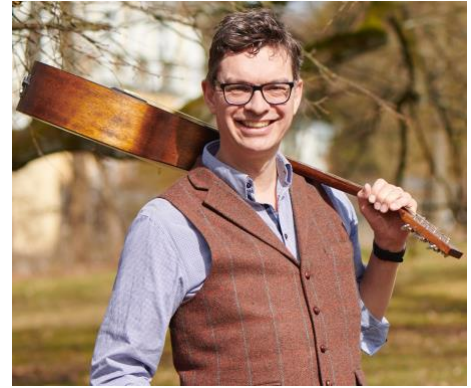
Porträt